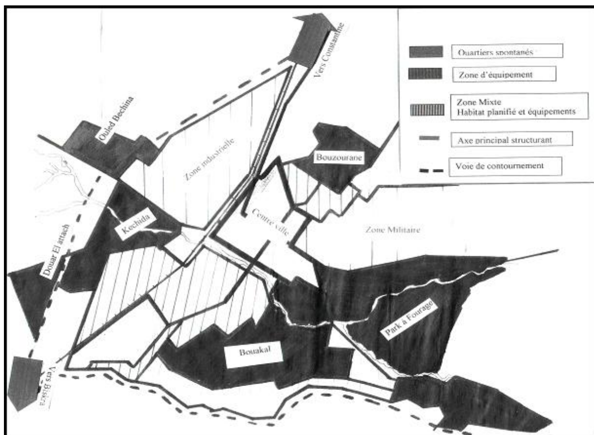
Figure n°2: Schéma de la structure de la ville

Le schéma de structure spatiale de la ville permet de constater l'existence d'importantes coupures au niveau du tissu urbain. Des coupures qui isolent le centre des quartiers spontanés périphériques. Ces coupures sont représentées par : la zone militaire au sud est occupant une superficie d'environ de 234 ha constituant une barrière physique importante entre le centre et le quartier Parc à Fourrage et la zone industrielle au Nord –ouest s'étalant sur une superficie de 251,15 Ha qui marque à son tour une zone d'exclusion du quartier spontané de Kéchida. Cette exclusion est plus prononcée dans le cas des sites anarchiques nouvellement implantés Ouled Béchina et Hamla situés au delà du périmètre urbain le long des voies de contournement Nord.